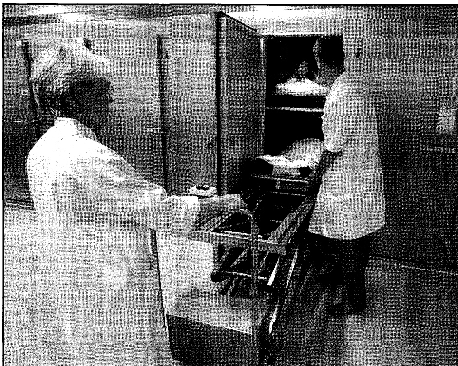
L'entomologie médico-légale permet de déterminer la date d'un décès en fonction des stades de développement des insectes nécrophages trouvés sur un corps.